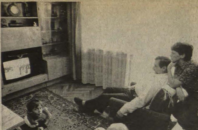
GDANSK — Lech Wałęsa oraz członkowie jego rodziny śledzili przybycie Ojca Świętego do Polski jedynie na ekranie telewizora.

Popierajcie tych, którzy ogłaszają się w "Dzienniku Związkowym".